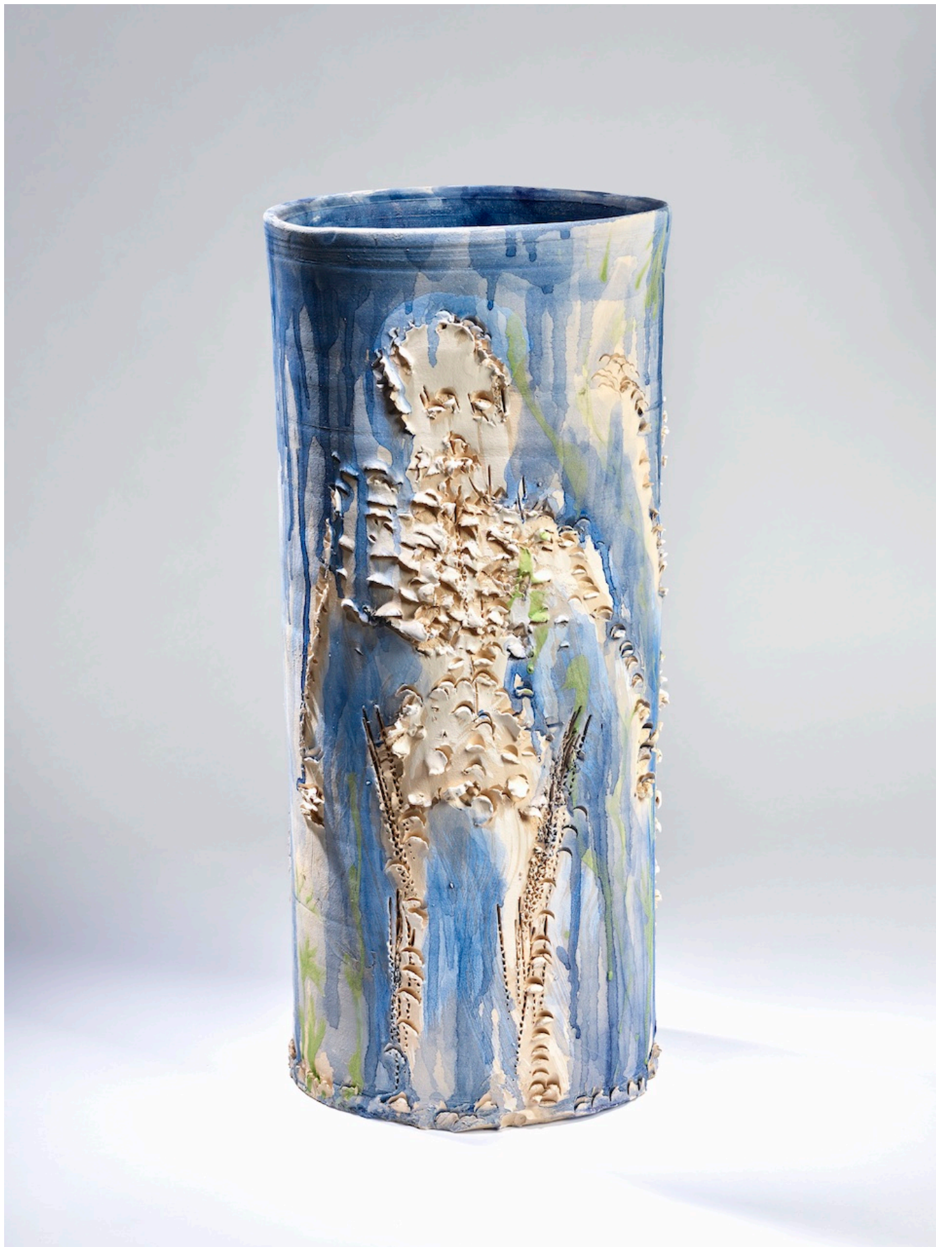
Мигель Барсело, Без названия, 2022 © Miquel Barceló, ADAGP Paris, 2023. Photo Luis Lourenço.

Интересно, что скарификация не ведаёт гендерных различий и наблюдается как у мужчин, так и у женщин, причем на любых частях тела: лице, груди, спине, плечах,