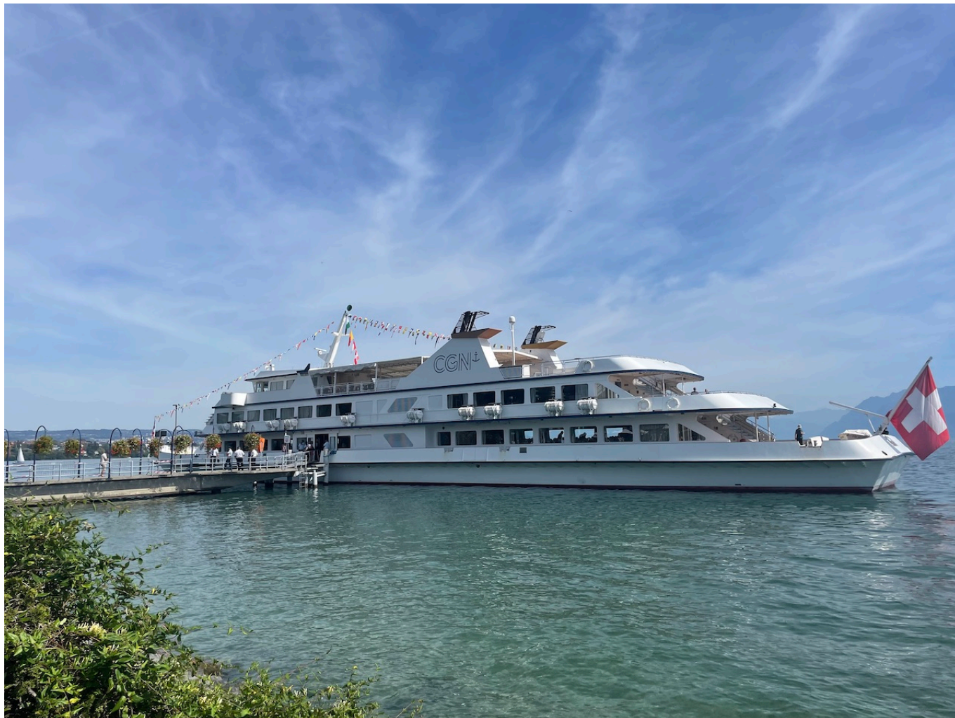
Швейцарский литературный пароход

PS К концу фестиваля издательство Éditions Noir sur Blanc распродало все привезенные на него книги Гузель Яхиной и Андрея Куркова. Вот это здорово!