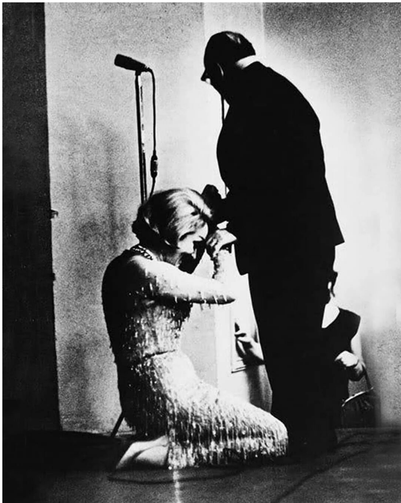
Марлен Дитрих и Константин Паустовский, Москва, ЦДЛ, 1964 г.