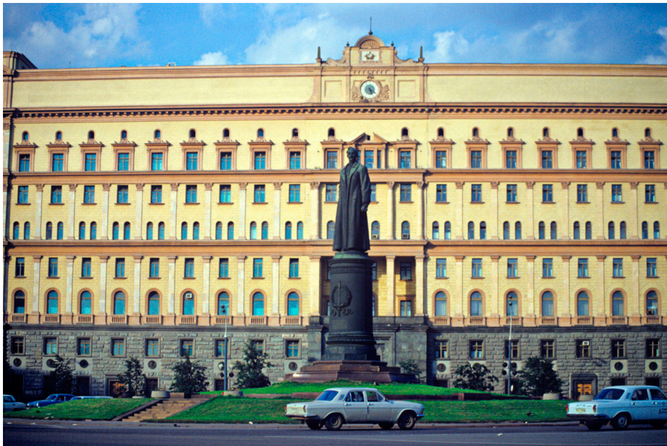
Памятник Ф. Э. Дзержинскому на Лубянской площади в Москве перед демонтажом 22 августа 1991 года

Не кажется ли Вам, что вместо того, чтобы сносить памятники, было бы лучше сопровождать их табличками с объяснением, почему произошла переоценка деятельности того или иного человека?