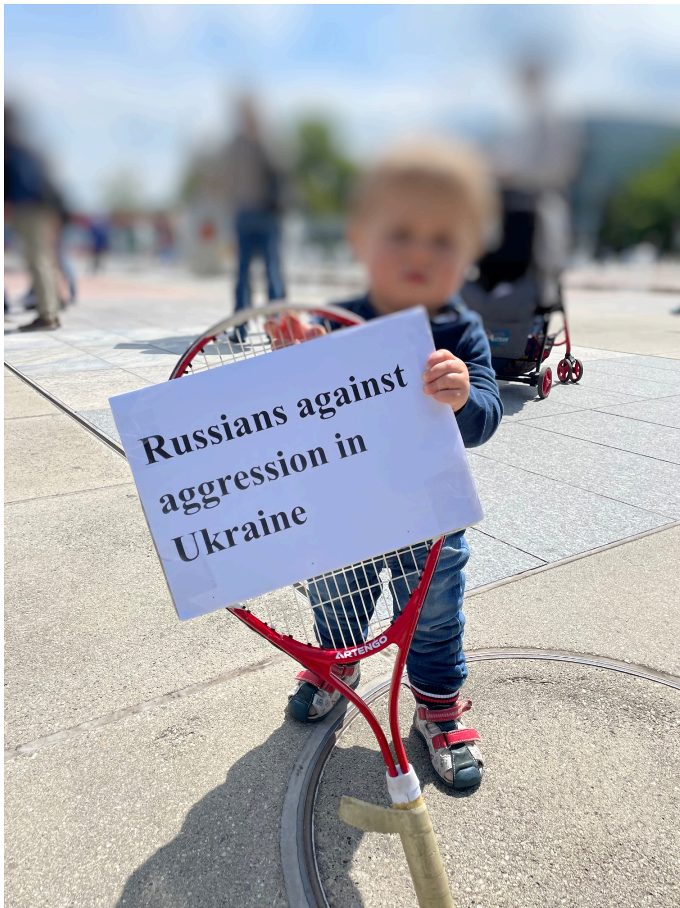
Самый юный участник манифестации

... Традиционно в этот день мы пишем что-то жизнеутверждающее. Часто используем цитаты из известных всем стихов, песен, фильмов о войне. О той, прошлой, общей войне, сегодня вытесненной нынешней. И сегодня ничего жизнеутверждающее на ум