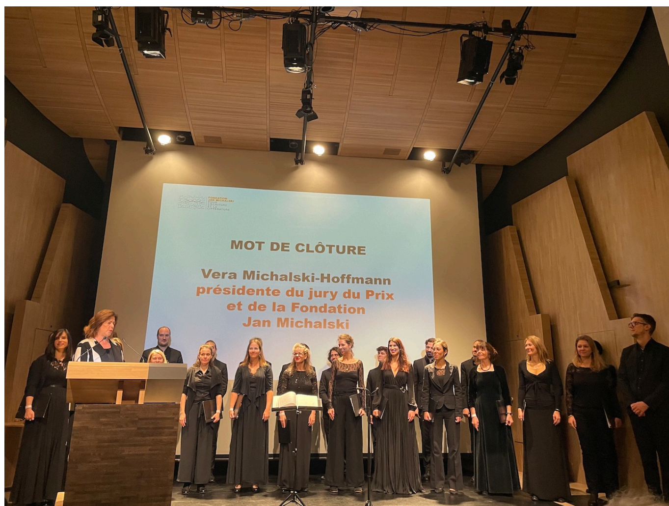
Вокальный ансамбль из Лозанны прекрасно пел по-русски