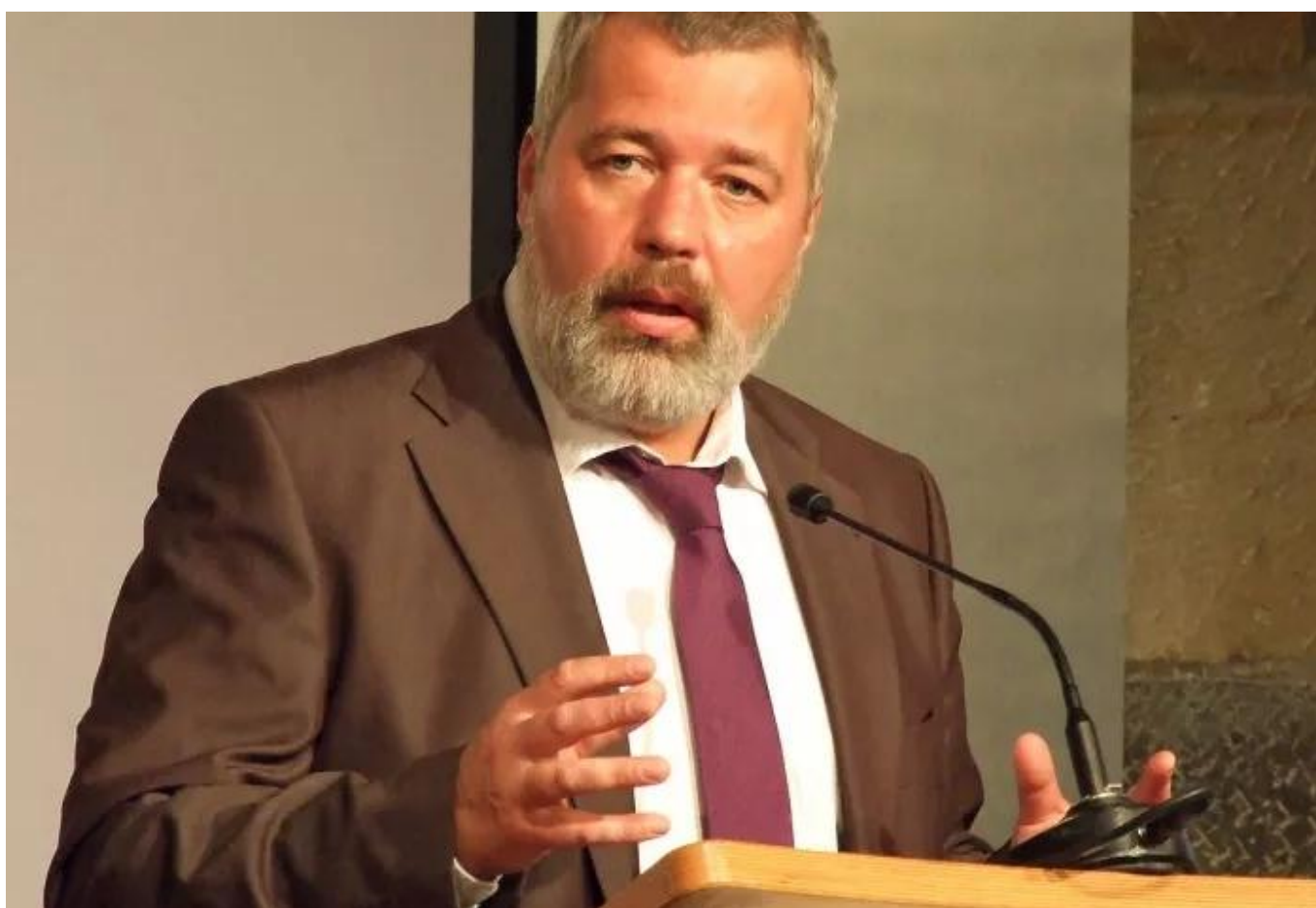
Дмитрий Муратов

8 октября Норвежский Нобелевский комитет в Осло объявил очередных лауреатов Нобелевской премии мира – наверное, самой политизированной из пяти, учреждённых шведским физиком и филантропом Альфредом Нобелем в его завещании, написанном 27 ноября 1895 года в Париже. На этот раз премию поделили два журналиста – филиппинка Мария Ресса и россиянин Дмитрий Муратов.