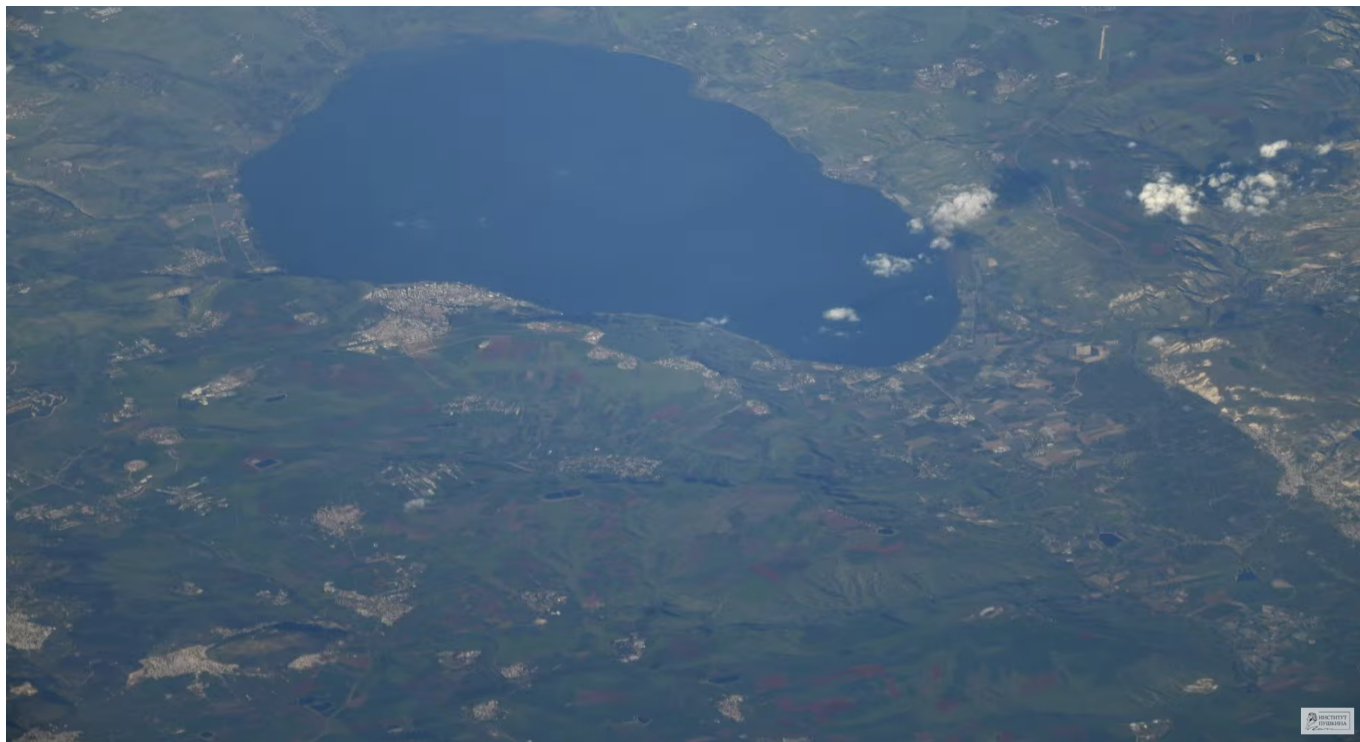
Так выглядят из космоса Галилейское море и гора Фарон