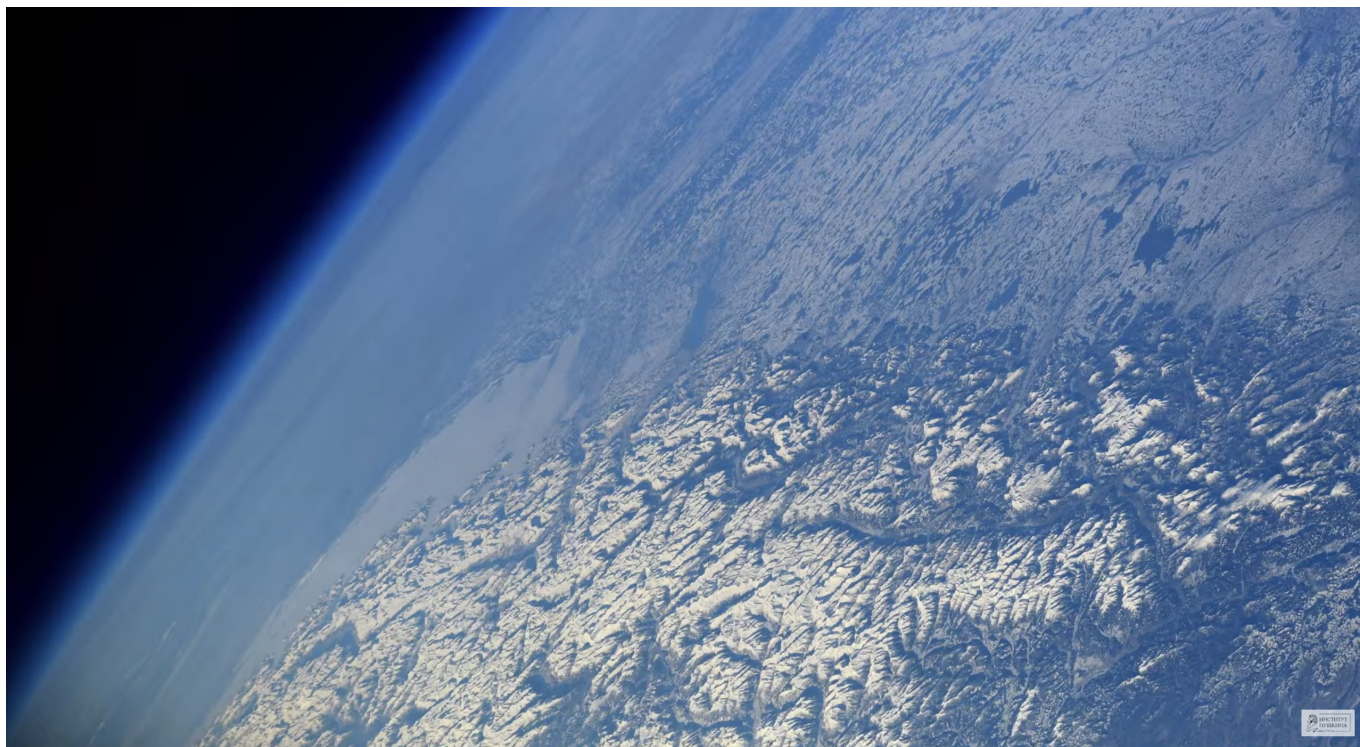
Альпы, вид из космоса

Мы не собираемся пересказывать содержание беседы, поскольку у вас есть возможность посмотреть ее в записи, и это как раз тот случай, когда точно лучше один раз увидеть, чем сто раз прочитать. Поделимся лишь своими впечатлениями.