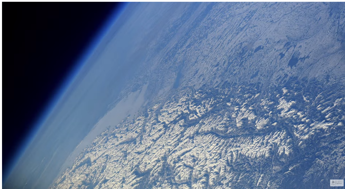
Альпы, вид из космоса

Мы не собираемся пересказывать содержание беседы, поскольку у вас есть возможность посмотреть ее в записи, и это как раз тот случай, когда точно лучше один раз увидеть, чем сто раз прочитать. Поделимся лишь своими впечатлениями.