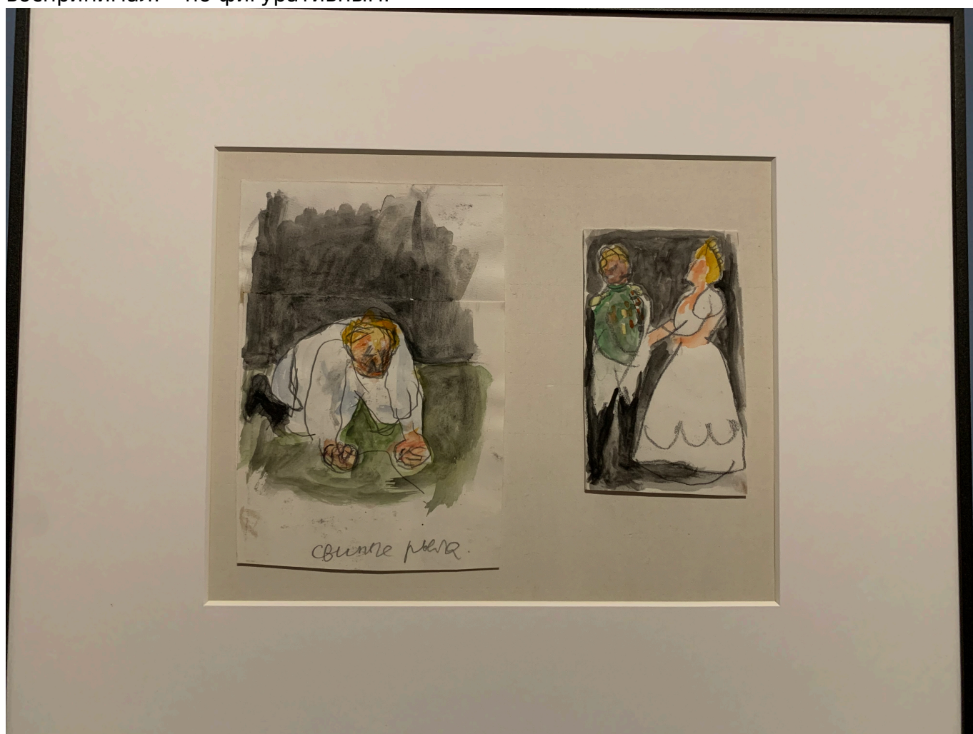
Юзеф Чапский. Два эскиза к "Ревизору", 1980 г.

Известно, что решение стать художником было принято им после того, как в Национальной галерее в Лондоне он увидел картину Камилля Коро «Господин Пиво на коне». Собственное сильное впечатление от нее, пронесенное через всю жизнь, подтолкнуло его к тому, чтобы внимательно наблюдать за тем, как реагируют на живописные полотна другие. Некоторые результаты этих наблюдений собраны в разделе «Сцены в музее» – здесь и Лувр, и Джакометти, и очень любимый Чапским Николя де Сталь, которого он считал не абстрактным художником – их он не воспринимал! – но фигуративным.