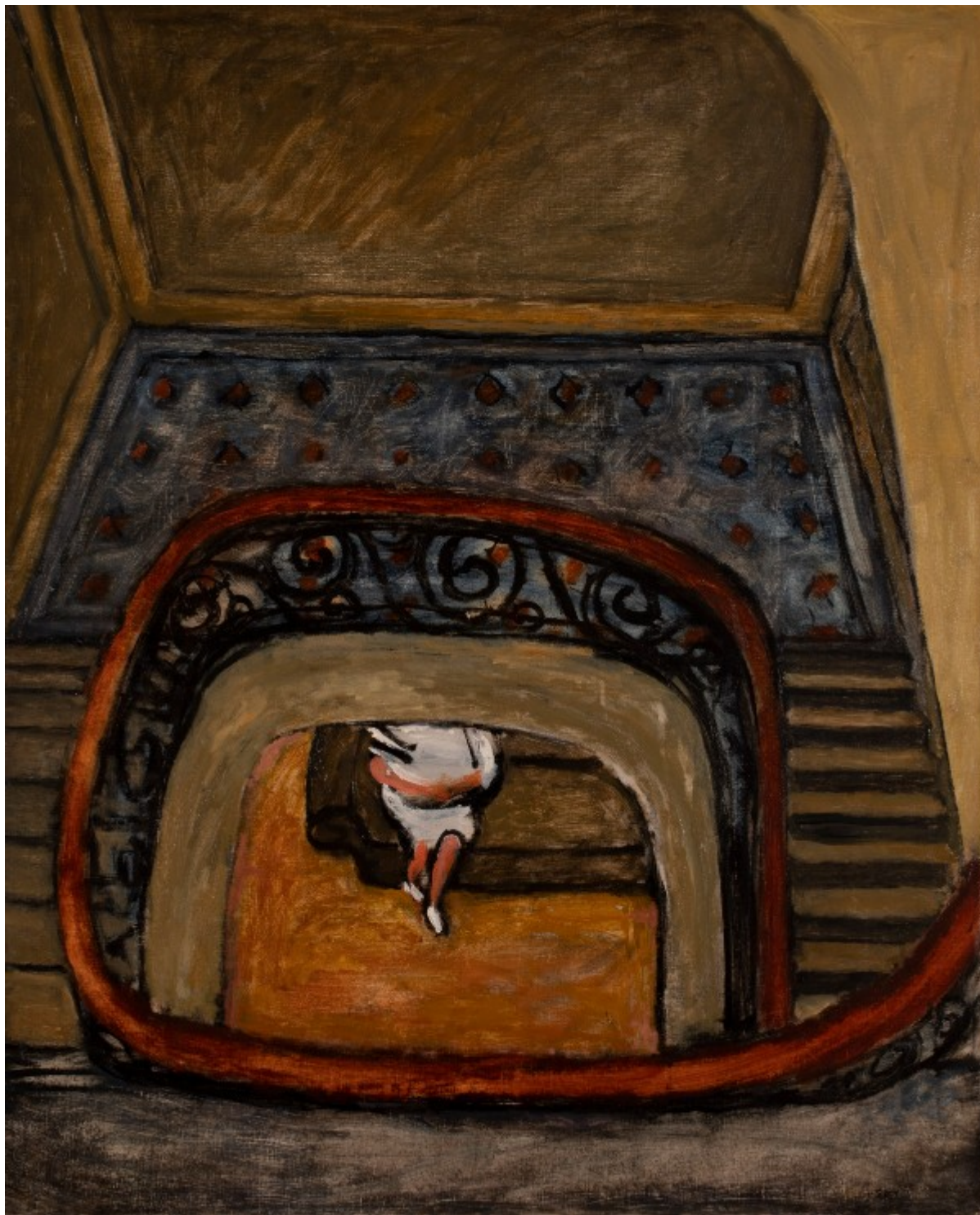
От наброска в дневнике - к картине. Юзеф Чапский. Лестница, 1964 г. Масло, холст.