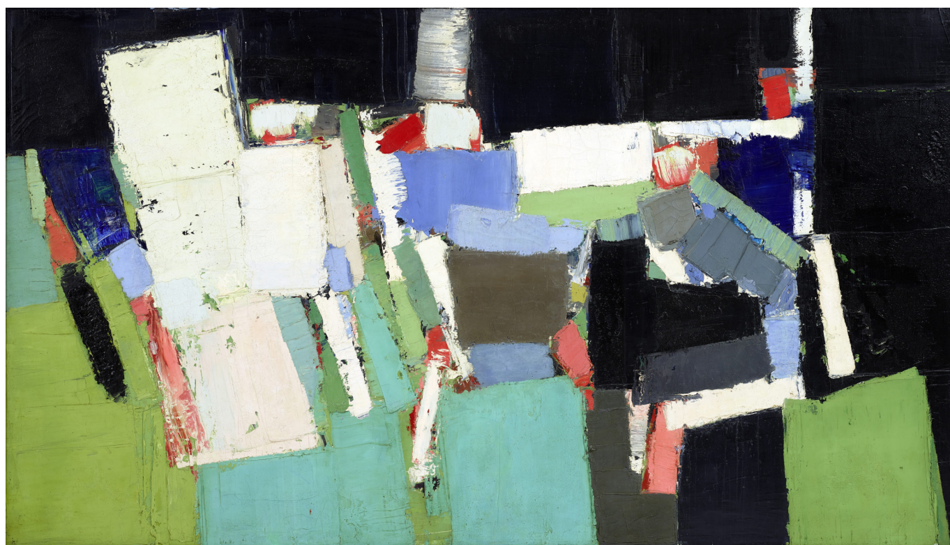
Николя де Сталь. Parc des Princes, 1952 г. Collection particulière