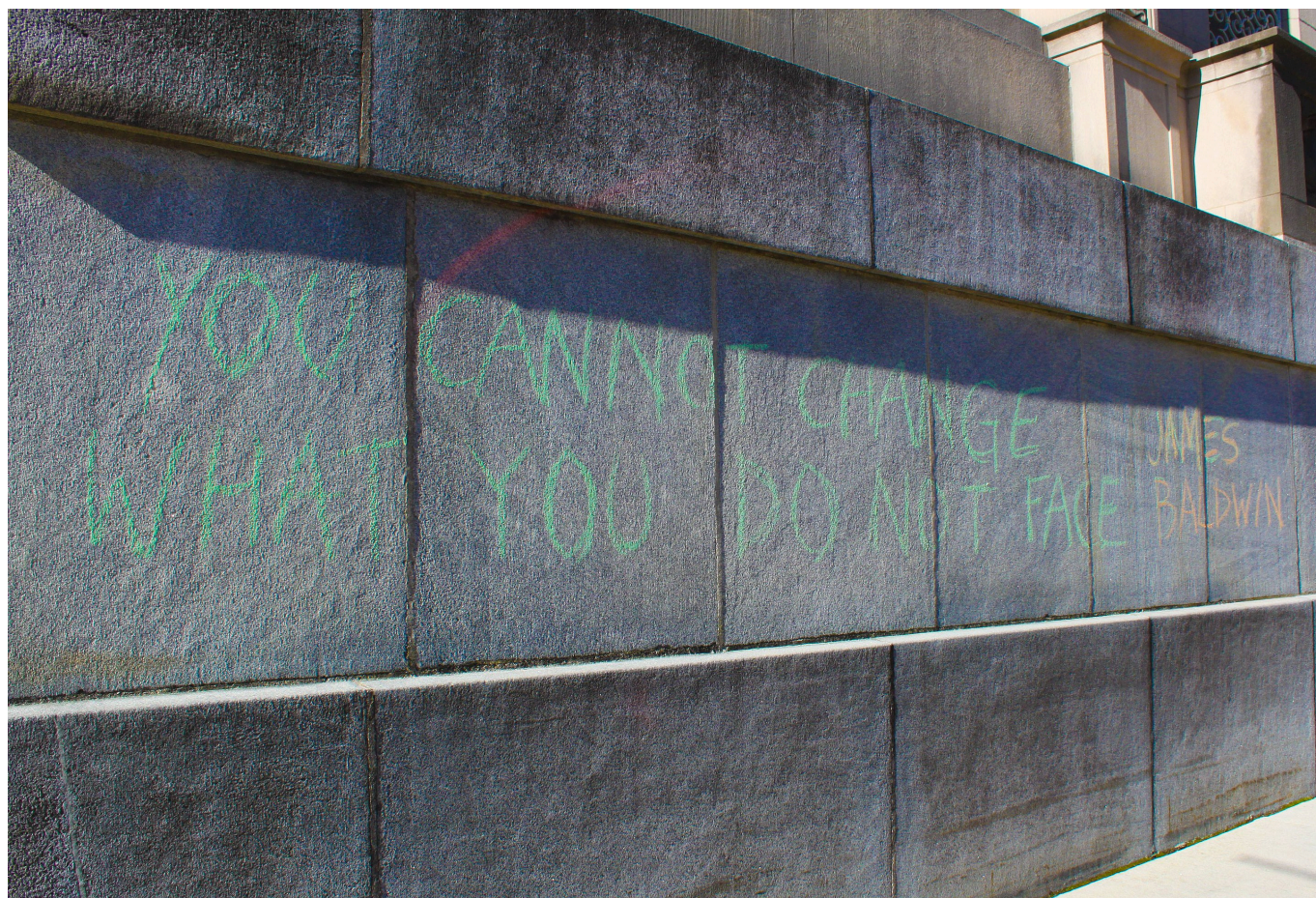
Граффити с искаженной цитатой из текста Дж. Болдуина на акции в поддержку Джорджа Флойда в Индианаполисе, 2020 г.

Возможно, именно это плюс движение Black Lives Matter, о проявлениях которого в Швейцарии мы уже рассказывали , а многие участники которого считают Джеймса Болдуина своим идейным и духовным лидером, и навело кураторов Художественного музея Аарау на мысль об организации выставки, которую мы находим оригинальной и познавательной. Около сорока художников, многие из которых живут в Швейцарии, но родились в странах Африки или в США, исследуют вопросы принадлежности и расовой изоляции: часть работ хранятся в собрании музея, остальные были заказаны специально для этой экспозиции. Но гвоздь программы – очень любимый нами писатель, с которым нам выпало счастье лично пообщаться еще в юности и который произвел на нас неизгладимое впечатление как своими книгами, так и личностью.