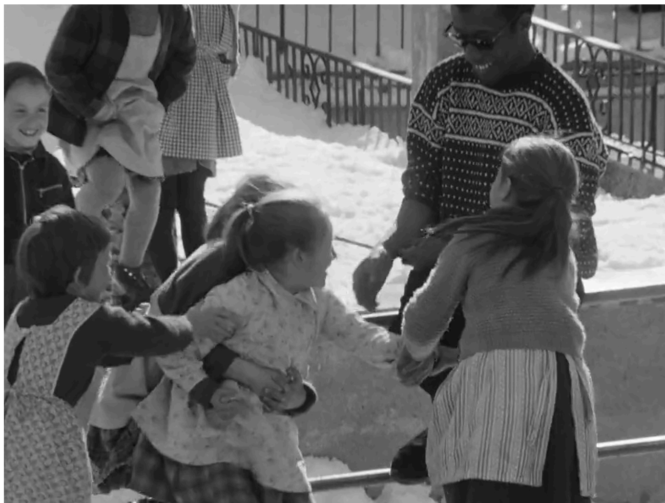
Пьер Коральник. « Чужак в деревне », 1962 г. С Дж. Болдуином. Видео.

Джеймс Болдуин писал о том, что видел, слышал и чувствовал, обобщая личные впечатления в общую картину окружающей его реальностью. Уже в самых первых его публицистических текстах чувствуется мощь трибуны, готового посвятить жизнь борьбе со всеми формами расизма – эта тема в той или иной степени проходит через все его книги.