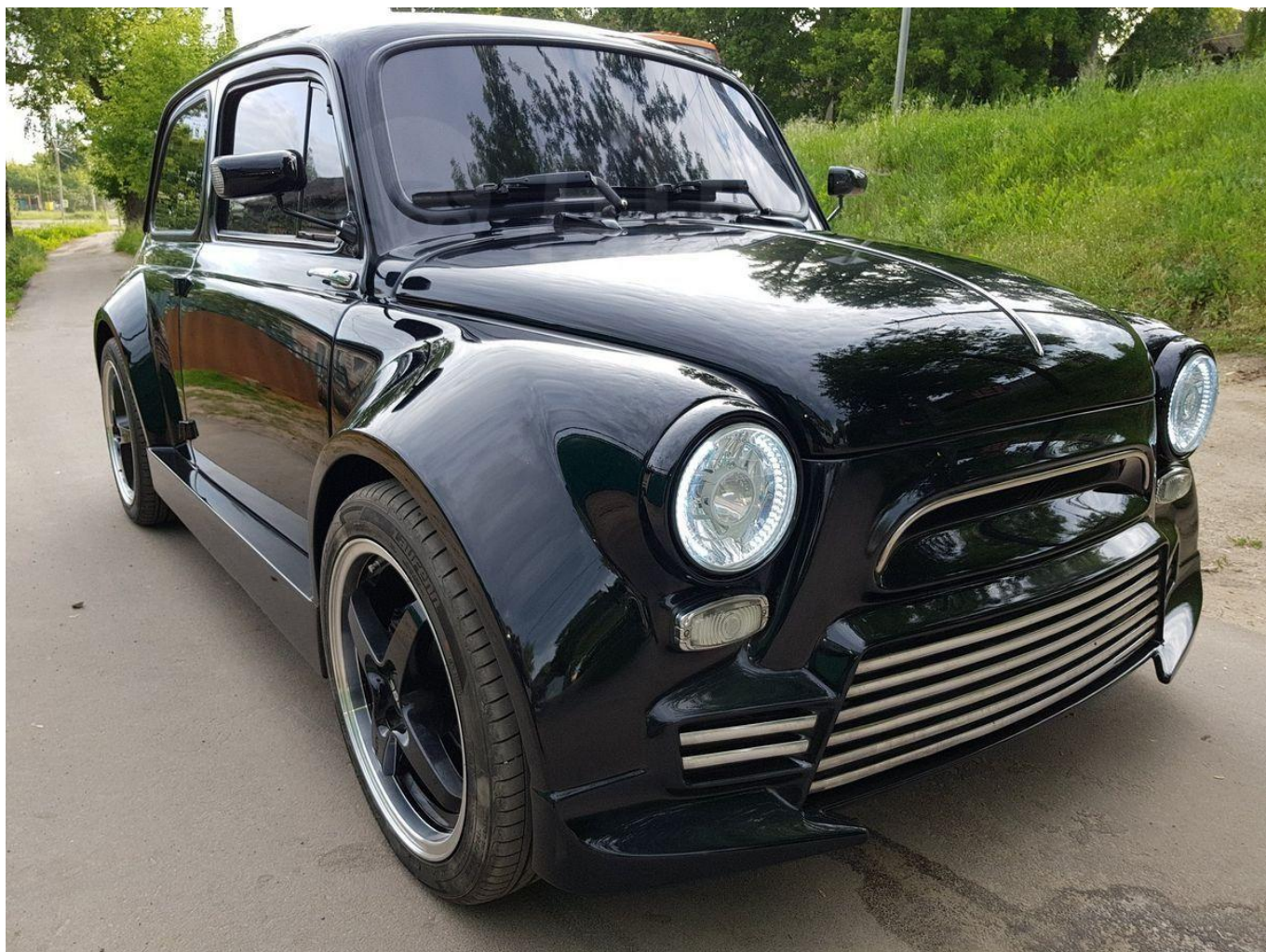
"Запорожец", модель 1967 г.

параллельной реальности, их присутствие при сцене похищения человека из ресторана или расстрела ни в чем не повинных собак, встречи с мафией и сотрудниками КГБ - порой они оказываются «коллегами» и изрекают одинаковые сентенции типа: «Если бы русские могли доверять своему правительству, мы были бы самой богатой страной в мире».