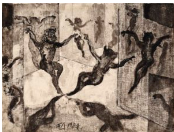
F. Dürrenmatt, Illustration à la ballade "Le Minotaure", Дюрренматт Ф. Иллюстрация I к балладе «Минотавр». 1984 г. © CDN / Schweizerische Eidgenossenschaft

Dans la littérature russe on distingue deux périodes majeures : l'Âge d'or (celui du XIXe siècle, couvrant à peu près l'œuvre de Pouchkine à Tchekhov) et l'Âge d'argent – plus court, concernant surtout la poésie du premier tiers du XXe : Goumilev, Akhmatova, Tsvetaïeva, Mandelstam, Blok et tant d'autres... Étonnement, en Russie, alors qu'il y tant de « maisons-musées » vouées à divers écrivains, il n'y a pas de musée de la littérature de l'Âge d'argent, une des filiales du « grand » Musée d'État de la littérature. Il se trouve à Moscou, dans une belle villa couleur turquoise où, en 1910-1924, habitait, au premier étage, un grand poète de l'époque Valeri Brioussov , son roman "L'Ange de feu" est paru récemment chez Les Editions Noir sur Blanc. (Drôle de coïncidence : l'idée de créer le Musée de la littérature en Russie – inauguré en 1933 – est venue à l'esprit du camarade et, de facto, secrétaire particulier de Lénine, Vladimir Bonch-Brouévitch pendant son exil à Genève, en 1903.)