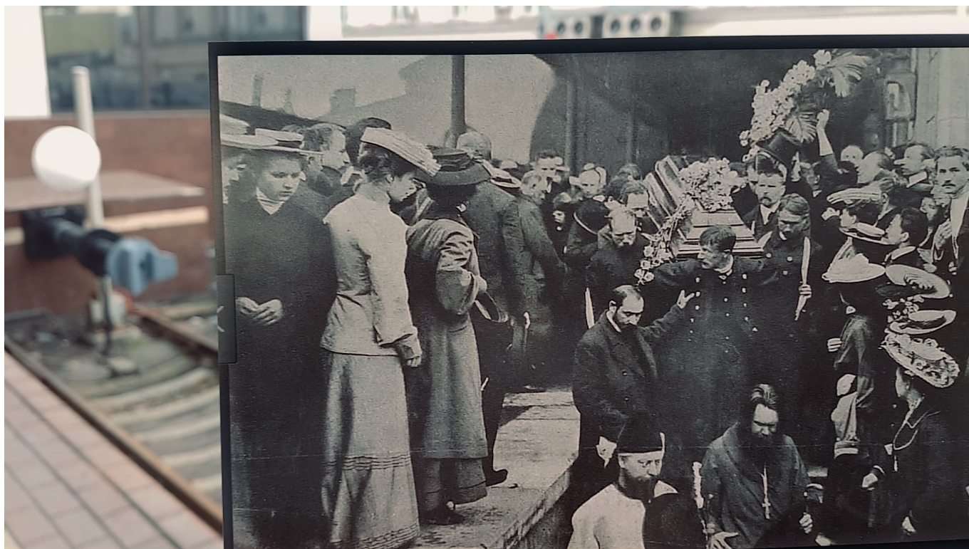
Arrivée du cercueil d'Anton Tchekhov à la gare Nikolaïevski