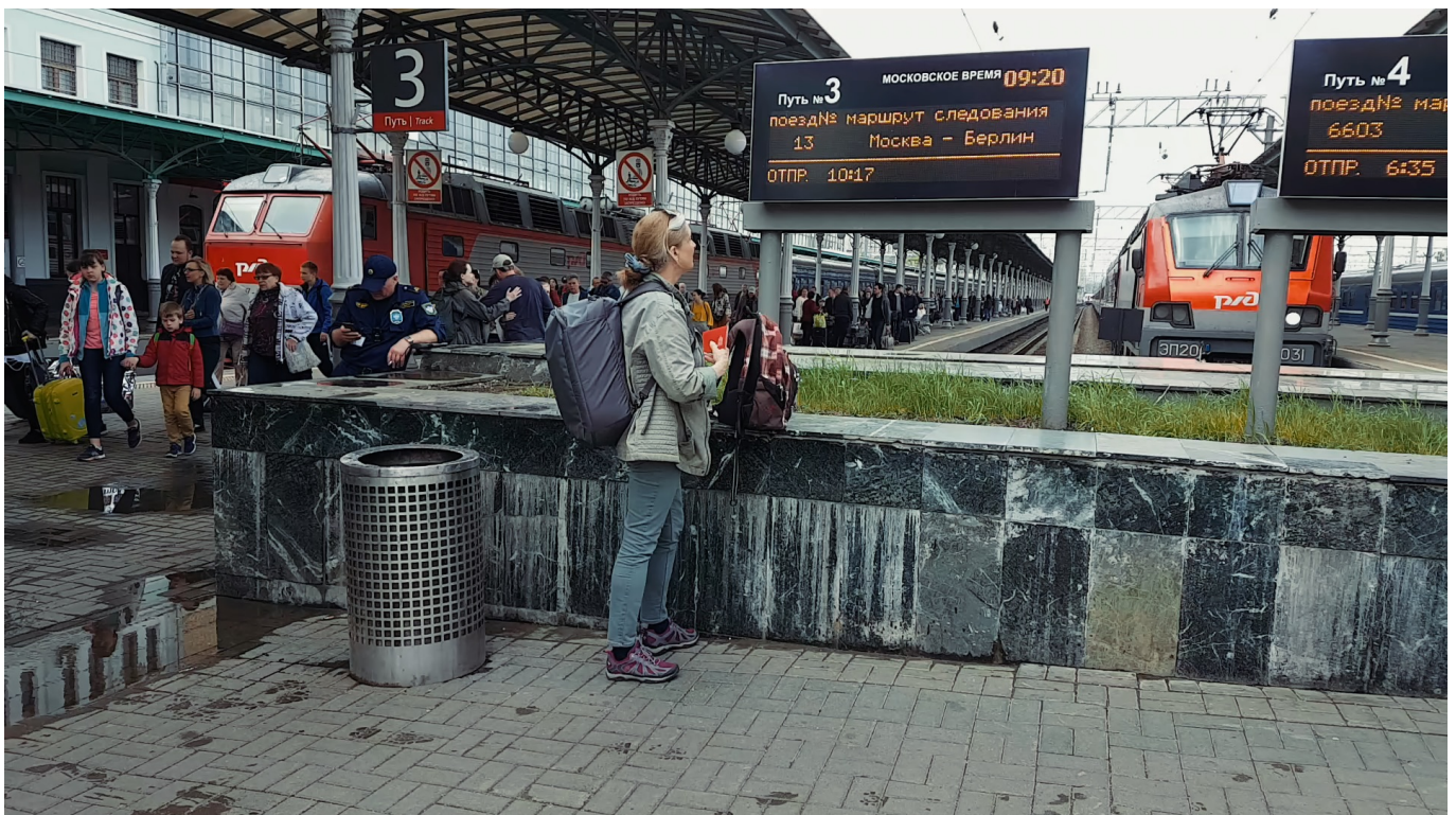
Dominique de Rivaz part de Moscou pour Berlin

C'est ainsi que Dominique de Rivaz entame son récit, en privilégiant une explication romantique du choix de cette langue par Tchekhov à une interprétation plus pragmatique. Dans les derniers instants de sa vie, passés dans la ville allemande de Badenweiler, il était auprès de son médecin, le docteur allemand Schwörer, qui constata sa mort et en informa l'épouse de l'écrivain, Olga Knipper-Tchekhova. Quoiqu'il en soit, Dominique de Rivaz a suivi les traces de Tchekhov dans son dernier voyage, en construisant une structure polyphonique de son essai en écho à celle de ses pièces, où de multiples voix se répondent, se font écho ou s'éteignent pour laisser place au silence.