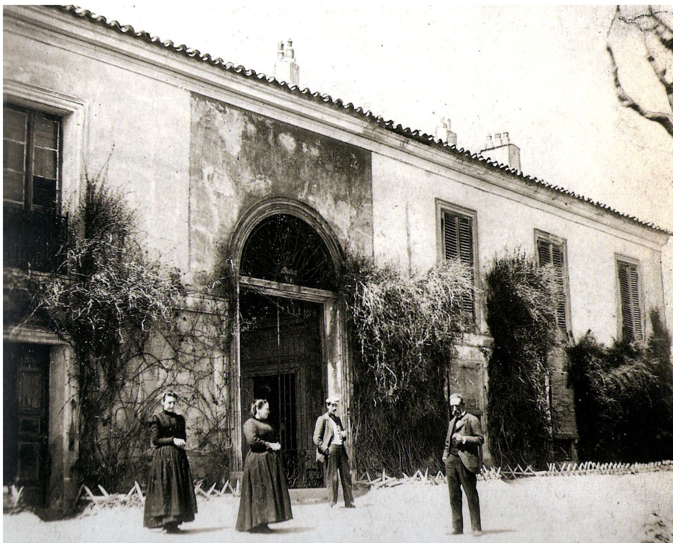
Quinta del Sordo, c. 1900 La Ilustración Española y Americana, 15 juillet 1909

En octobre dernier je vous ai parlé de l'exposition que la Fondation Beyeler à Bâle consacre à Francisco Goya à l'occasion du 275 e anniversaire de sa naissance. Dans ce texte je vous ai recommandé Le Roman de Goya de Lion Feuchtwanger. Je maintiens cette recommandation, mais j'ai depuis découvert un autre livre qui m'a beaucoup impressionné et que j'aimerais partager avec vous, d'autant plus que l'exposition continue jusqu'au 23 janvier. Il s'agit du roman « Saturne » de Jacek Denhel, écrit en 2011 et paru aux Éditions Noir sur Blanc en 2014 déjà.