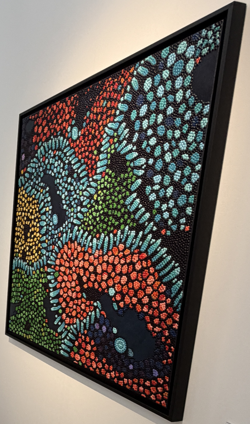
RAINBOW CORN © Laure Hatchuel-Becker 2018