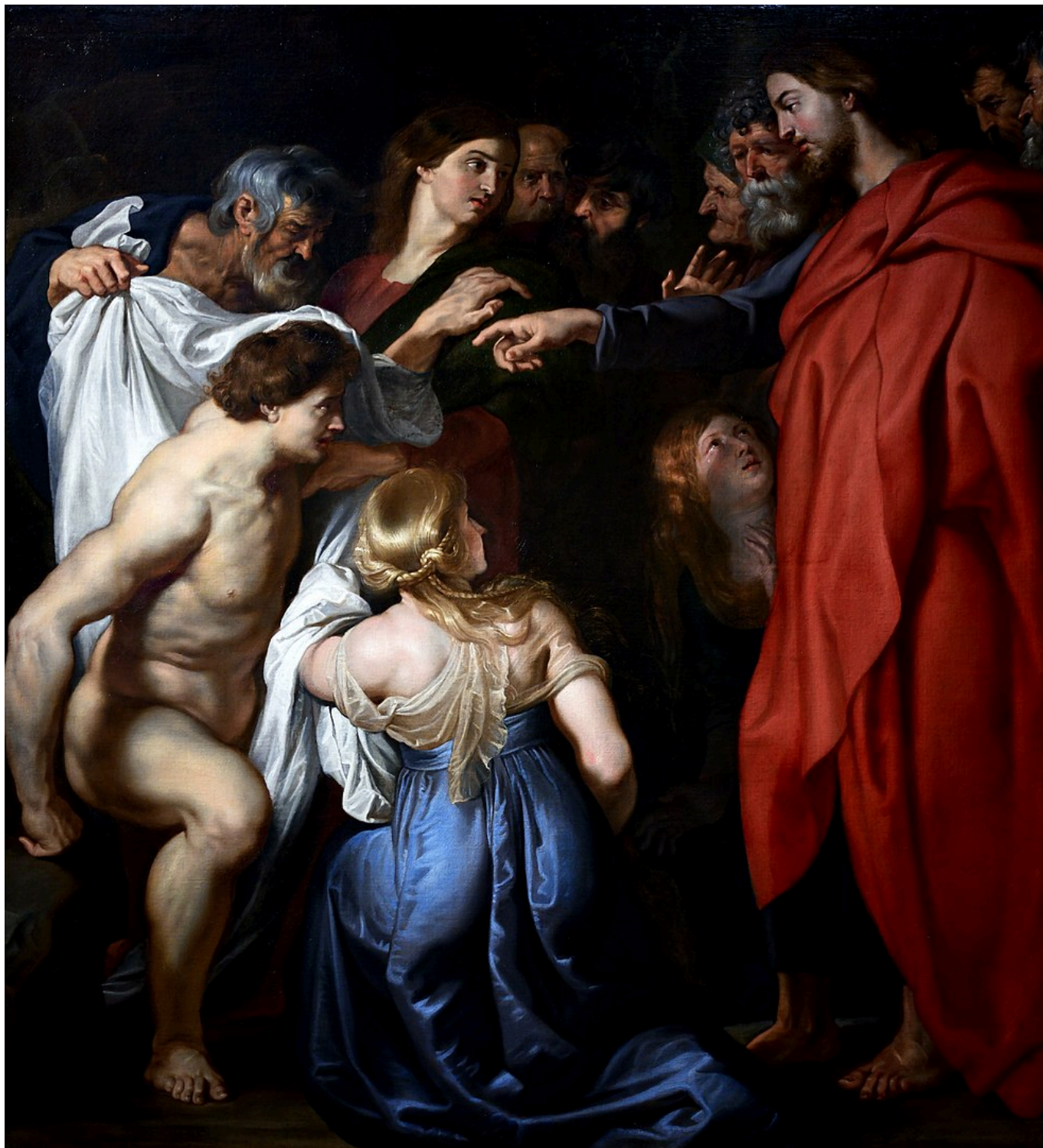
Питер Пауль Рубенс. Воскрешение Лазаря, 1606 г.

Вы пишете о мертвых. Но пишете так, словно знали их всех лично. А может, действительно, удалось еще застать кого-то из персонажей? Или пообщаться с потомками?