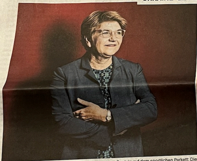
Die Bundespräsidentin auf dem diplomatischen, der Nati-Captain auf dem sportlichen Parkett: Die Schweiz steht doppelt unter Beobachtung.